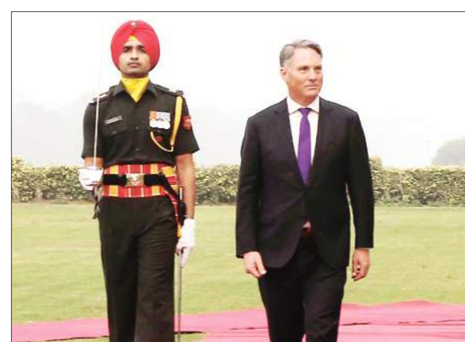
ऑस्ट्रेलिया के डिप्टी प्राइम मिनिस्टर गार्ड ऑफ ऑनर लेते हुए।

टीम एक्शन इंडिया/नई दिल्ली उपराज्यपाल वीके सक्सेना ने सोमवार को 10 हजार से अधिक होम गार्ड भर्ती करने की मंजूरी दे दी है। एलजी के चयन में अतिरिक्त क्रेडिट के माध्यम से सिविल डिफेंस वालंटियर्स को प्राथमिकता देने का निर्देश दिया है। इसके साथ ही दिल्ली के उपराज्यपाल ने समयसीमा तय करने के निर्देश भी जारी किए गए हैं। भर्ती