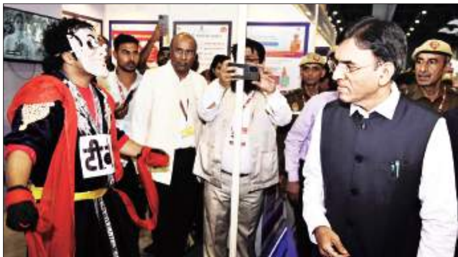
इंटरनेशनल ट्रेड फेयर का मुआयना करते हुए केंद्रीय स्वास्थ्य मंत्री डॉ. मनसुख मांडविया।

अर्घ्य देकर पूजा की गई। व्रतीधारी महिलाओं ने तालाब के घुटने व कमर भर तक पानी में खड़े होकर पूजा की, इस दौरान काफी संख्या में लोग मौजूद थे। सभी ने सामूहिक रूप से पूजा अर्चना कर खुशहाली की कामना की।